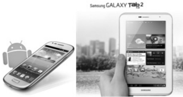
Gambar 1.2. Smartphone dan Tablet Samsung