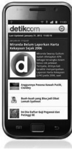
Gambar 1.5 Detik Portal dilihat melalui ponsel Android

Jadi apakah web service itu? Secara singkat Web Service adalah aplikasi yang dibuat agar dapat dipanggil atau diakses oleh aplikasi lain melalui internet dengan menggunakan format pertukaran data sebagai format pengiriman pesan . Adapun yang dibahas didalam buku ini adalah format pertukaran data dengan XML dan JSON .