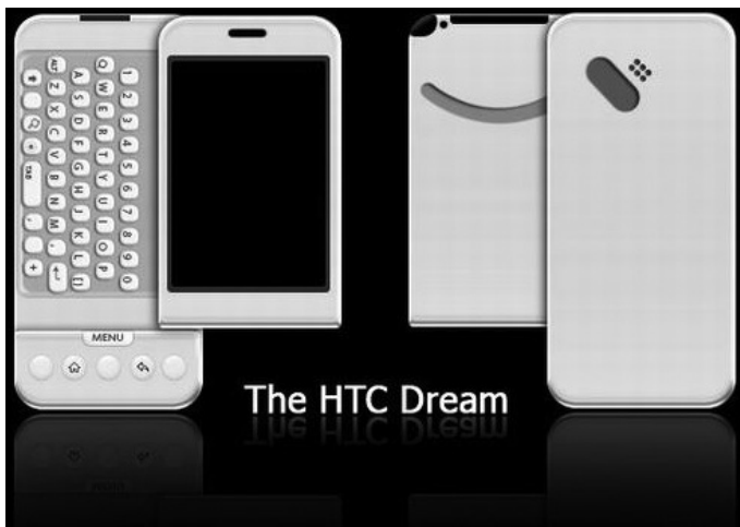
Gambar 1.1. HTC Dream

Pada bulan September 2007, Google mulai mengajukan hak paten aplikasi telepon seluler. Disusul dengan dikenalkannya perangkat seluler Android yang pertama pada tahun 2008, yaitu HTC Dream yang menggunakan Android versi 1.0. Lihat gambar 1.1.