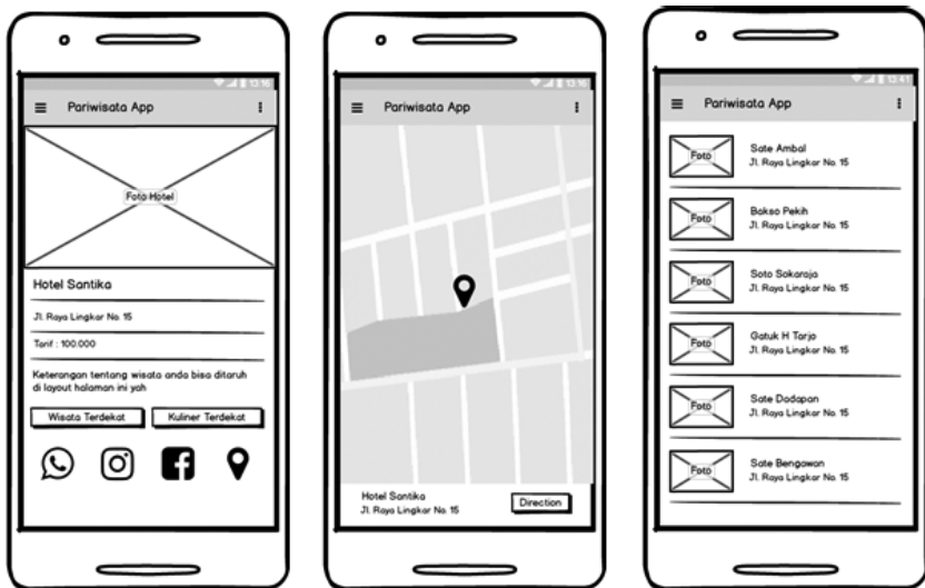
Gambar 1.4 Detail hotel, maps hotel dan list kuliner