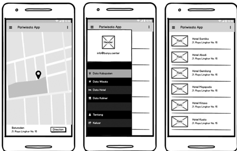
Gambar 1.3 Layout maps, navdrawer dan list hotel