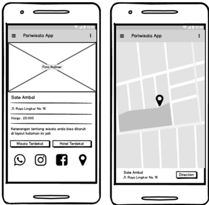
Gambar 1.5 Detail kuliner dan maps kuliner